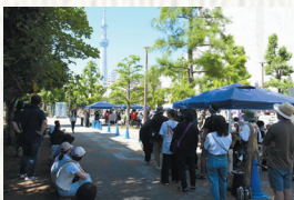
6月中旬に大横川親水公園でエキストラも参加した撮影が行われた

撮影は8割以上が墨田区内で行われ、墨田区観光協会を通じて「錦糸町を元気にする会」の施設や事業所もフィルム・コミッションに協力した。