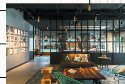
ラジオ局の場面に使われた「モクシー東京」のライブラリー