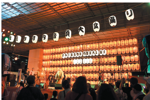
音頭取りの生唄で繰り広げられる壮大な河内音頭