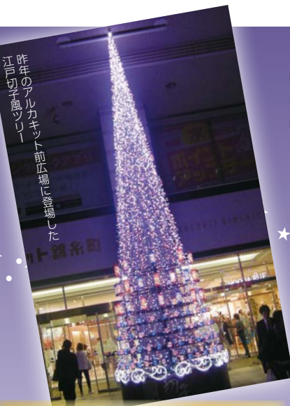
江戸切子風ツリー 昨年アルカキット前広場に登場した