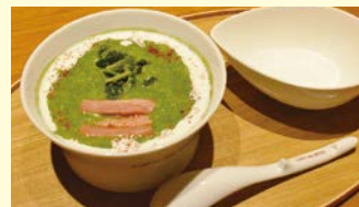
人気メニュー「ポパイ」。このほか中華粥のスタンダードとなる「チキン」「サカナ」「ピータン」も一度は試してほしい