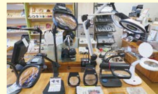
スタンドタイプのルーペ。用途に合わせてレンズを付け替えることのできるものもある