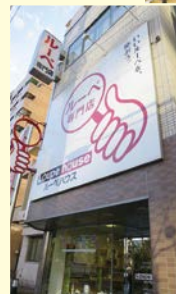
四ツ目通り沿いに立つ店舗